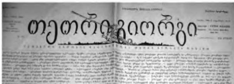
გაზეთ „თეთრი გიორგი“-ს ქული