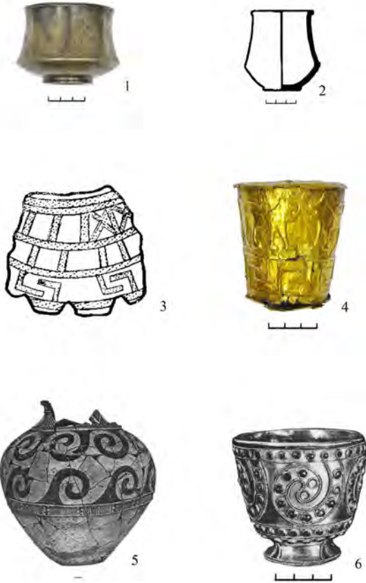
ტაბ. II Abb.