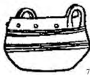
ტაბ. I Abb.